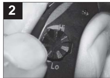
依個人需求調整適合音量