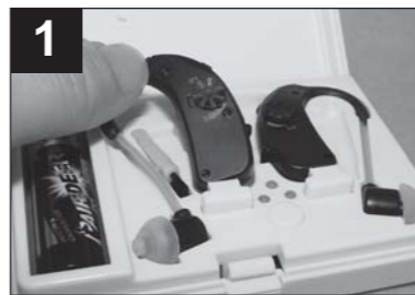
將助聽器自充電盒取出，開啟電源