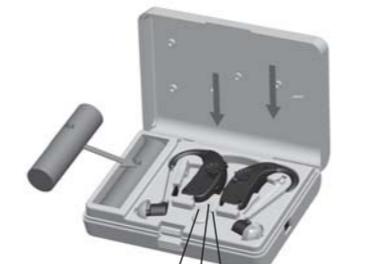
充電指示燈 ① 充電指示燈 ② 電源指示燈 ③

2. 按壓充電狀態測試鈕, 觀察充電指示燈 ① ② 與電源指示燈 ③ 是否為"綠燈", 即表示正常供電中。