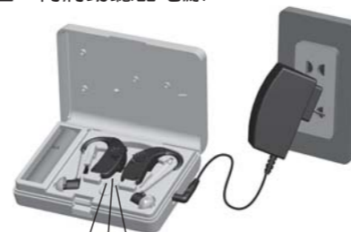
充電指示燈 ① 充電指示燈 ② 電源指示燈 ③

1. 先將變壓器接上充電盒, 並插上家用插座, 再將助聽器電源開啟後置入充電槽充電。